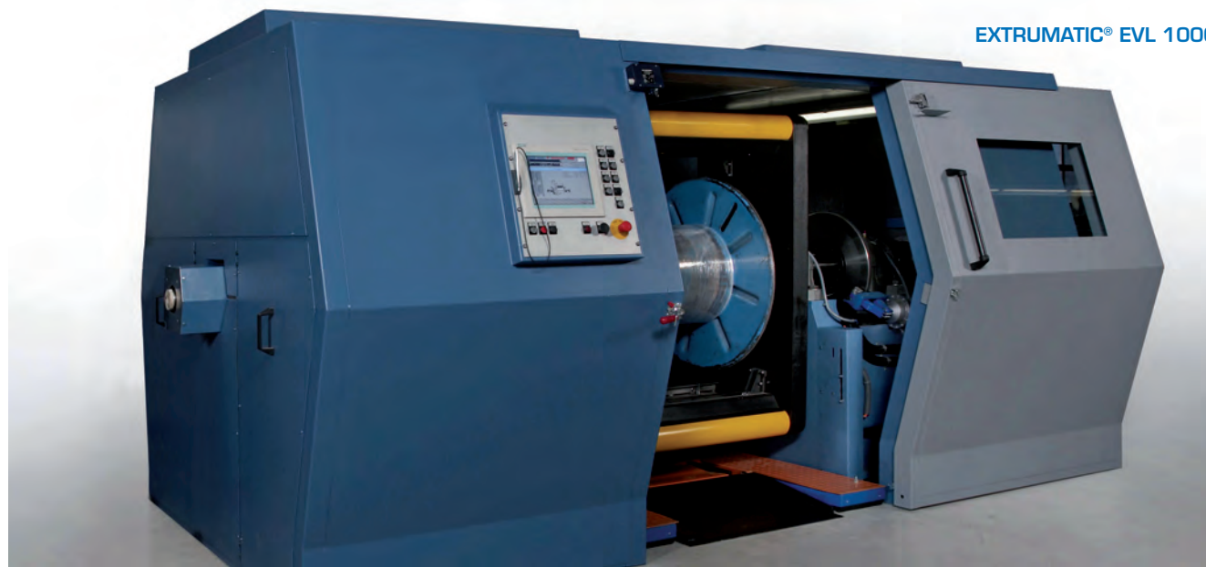
EXTRUMATIC® EVL 1000

KÜHNE+VOGEL Prozessautomatisierung Antriebstechnik GmbH, Zunftstraße 6, 91154 Roth, Tel. +49 (0) 9171/9656-0 Fax: +49 (0) 9171/5070, E-Mail: pa@kuehneundvogel.de www.kuehneundvogel.de